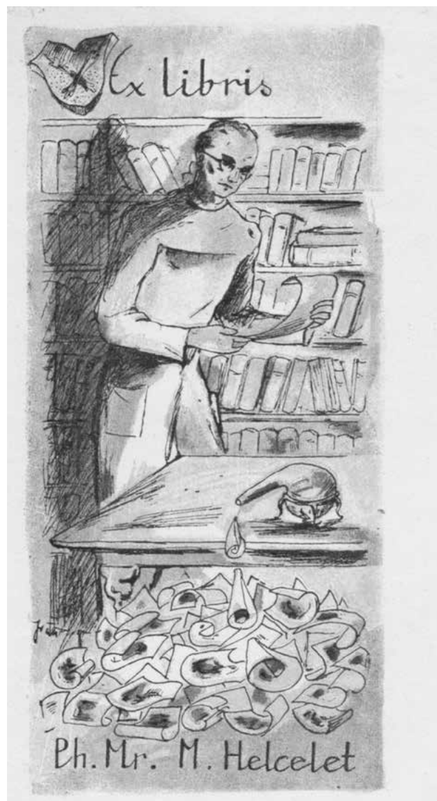
Obr. 3. Knižní značka Mojmíra Helceleta – farmaceutické exlibris (Jiří Vláčil, autotypie, 1944, Památník písemnictví na Moravě)