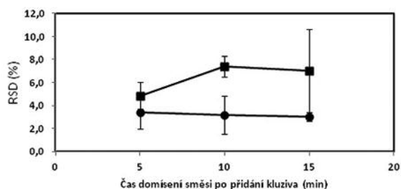
Obr. 1. Vliv času domísení na obsahovou stejnoměrnost tabletové směsi o složení 1 (■) a 2 (●) – dle tabulky 1; chybové úsečky znázorňují maximální a minimální hodnotu RSD v rámci připravených šarží