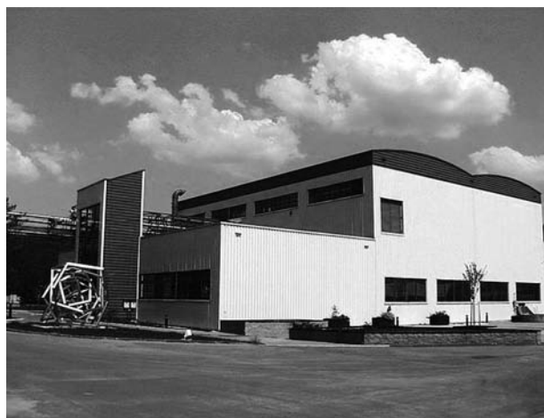
Obr. 4. Výrobna cytostatických injekcí 20