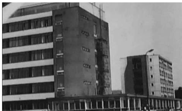
Obr. 1. Výstavba výzkumného ústavu a administrativní budovy

Původně byl podnik zaměřen na adjustaci čistých a speciálních chemikálií a nacházel se v Brně v Poděbradově ulici. Již v padesátých letech se ovšem Lachema stala předním výrobcem analytických činidel, indikátorů a barviv pro mikroskopii, stejně jako cukrů, aminokyselin a celé řady dalších chemikálií. Roku 1958 byl závod Lachema včleněn do národního podniku Spolana Neratovice, ale již v roce 1963 byla její činnost obnovena pod hlavičkou Výzkumného ústavu čistých chemikálií (VÚČCH), zřízením detašovaného pracoviště v budově Chemické fakulty Vojenské akademie na Žižkově ulici. Vznikly tak podmínky pro výzkum a vývoj v různých oblastech chemických specialit a za tímto účelem byl vybudován samostatný podnik v Brně Řečkovičích 3) .