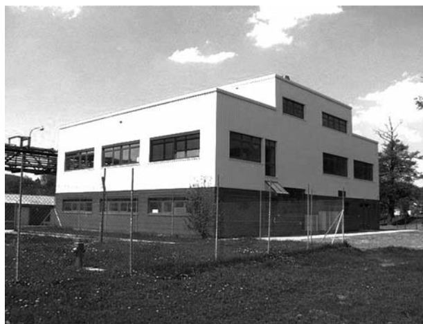
Obr. 3. Nový pavilon jakosti 20

Celkově po vlastnictví Chemapolu došlo ke stagnaci prodeje na úrovni přibližně 1 miliardy korun ročně, což vytvořilo velké ztráty a došlo k propadu Lachemy do červených čísel. Lachema je nucena přijmout pomoc od Plivy, ovšem, podle některých komentářů, s velkou mírou úrokových splátek 12 .