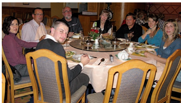
Společná večeře české reprezentace

Českou republiku zastupovalo na kongresu 14 farmaceutů z Výboru ČFS, ČLK, pedagogové i studenti DSP