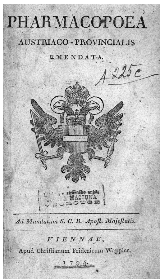
Obr. 1. Titulní stránka vydání lékopisu z roku 1794

Další tvarově specifickou formou byly Tabulae . Vídeňské dispensatorium obsahovalo dva druhy, z nichž provinciální lékopis převzal jen Tabulae de althaea . Připravovaly se smícháním jemně práškového proskurníkového kořene s cukrem a tragantovým slizem. Vzniklá