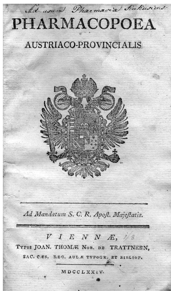
Obr. 1. Titulní list lékopisu z roku 1774

Složení galenických přípravků autoři obvykle upravili a vypustili z něho ty látky, které v daném přípravku nepovažovali za důležité. Někdy také pozměnili způsob přípravy a případně též upravili název článku. Opustili původní rozdělení článků do tříd podle lékových forem a seřadili články podle abecedy. Navíc do provinciálního lékopisu zařadili nové statě, např. soupis používaných léčivých a pomocných látek ( Materia pharmaceutica , v pozdějších vydáních přejmenovaný na Materia medi-