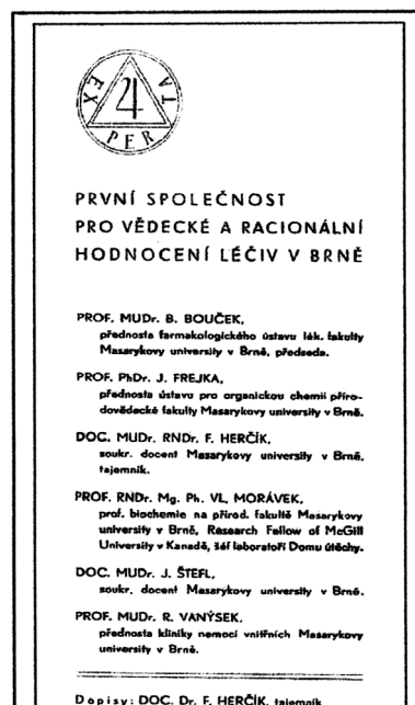
Obr. 1. Soupis členů Experty