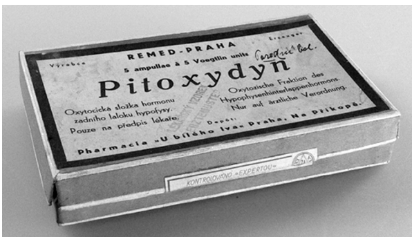
Obr. 4. Pitoxydyn inj. – originální přípravek (před 1939) označený páskou >Kontrolováno „Expertou“<