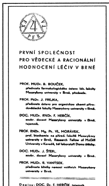
Obr. 1. Soupis členů Experty