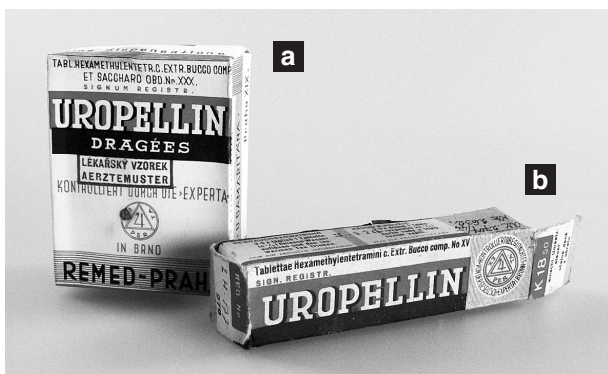
Obr. 7. Uropellin Dragées (a) (před 1939) a Uropellin Tablettae (b) (po 1939), kontrolované Expertou

10. Indikační označení muselo odpovídat ustáleným lékařským zásadám. Seznam chorob, proti kterým se mohl LP použít, musel být uveden způsobem pro laickou veřejnost nesrozumitelným .