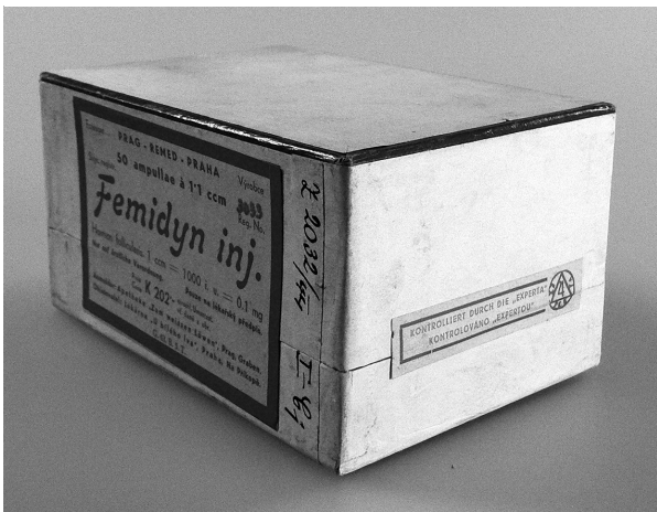
Obr. 5. Femidyn inj., registrační číslo 3033; originální přípravek >Kontrolováno „Expertou“<; kontrolní vzorek Ústavu pro zkoumání léčiv z roku 1944

8. Experta do své kontroly zásadně nezařadila, tzv. arkana (tajné léky), dále pak LP, které byly v ČSR zamítnuty, a LP, u kterých bylo zřejmé, že se nevyznačují přednostmi, které požaduje vládní nařízení o specialitách. Dále do seznamu Experty nemohla být zahrnuta tzv. komposita.