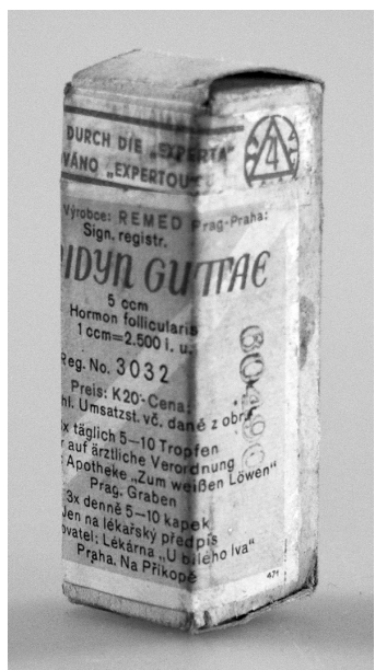
Obr. 6. Femidyn guttae, registrační číslo 3032; originální přípravek kontrolovaný Expertou (po 1942)