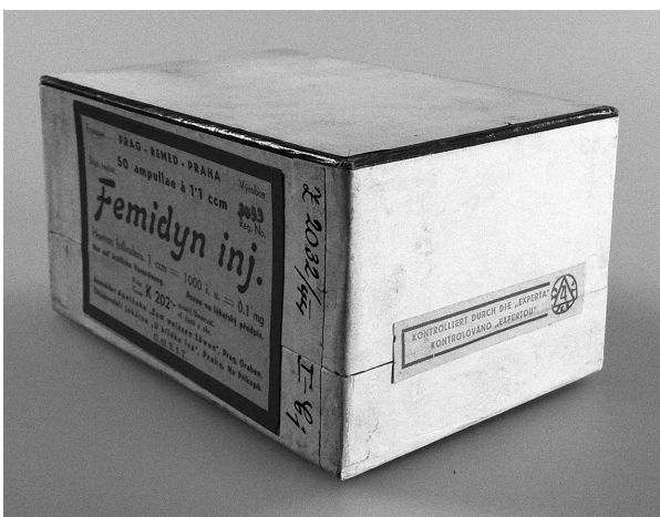
Obr. 5. Femidyn inj., registrační číslo 3033; originální přípravek >Kontrolováno „Expertou“<; kontrolní vzorek Ústavu pro zkoumání léčiv z roku 1944

8. Experta do své kontroly zásadně nezařadila, tzv. arkana (tajné léky), dále pak LP, které byly v ČSR zamítnuty, a LP, u kterých bylo zřejmé, že se nevyznačují přednostmi, které požaduje vládní nařízení o specialitách. Dále do seznamu Experty nemohla být zahrnuta tzv. komposita.