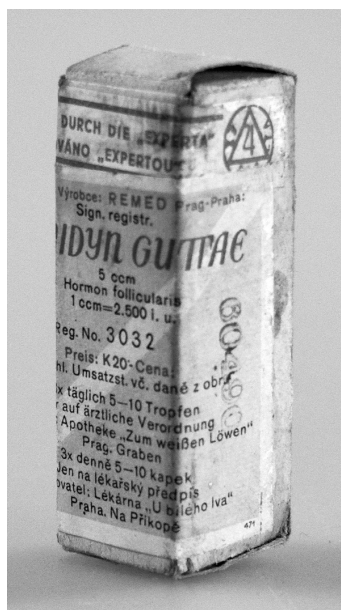
Obr. 6. Femidyn guttae, registrační číslo 3032; originální přípravek kontrolovaný Expertou (po 1942)