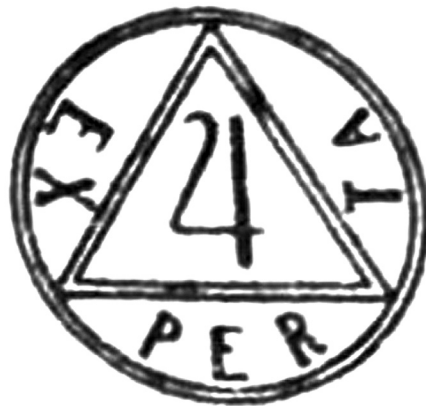
Obr. 2. Značka Experty, která zaručovala, že LP je obsahem, účinkem a složením pod stálou kontrolou Experty

3. Názorem zakladatelů Experty bylo, že kvalitní HVLP nemá být existenčně závislý na reklamě , že se dokáže udržet sám svou hodnotou. Každý LP, který měl být úspěšně uveden na trh, potřeboval mnoho reklamy a propagace. Snahou Experty bylo, aby se lékař nemusel řídit reklamou, která provázela jednotlivé LP, ale aby rozhodujícím faktorem pro volbu terapeutického užití konkrétního LP byly jeho všestranné jakostní zkoušky, objektivní a nezávislé na výrobci. Tyto vlastnosti Experta zaručovala umístěním svého loga na obalech LP a na informačních materiálech (obr. 2).